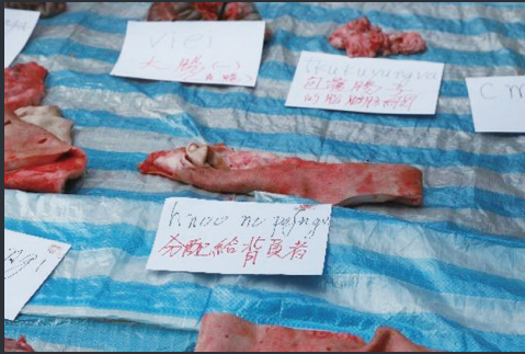
圖5 山豬各部位標記之鄒語及中文名稱