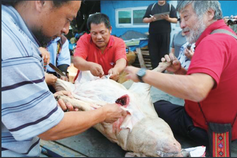
圖1 研究者帶領工作人員進行山豬解剖工作

賦嚴謹，呈現鄒族「經濟分配」和「社會規範」的制度，獵物除分給族人、親友及獵團，也要分配給土地神靈 ak'e mameoi 。在重要行事如戰祭 mayasvi 或建屋的時候，要以山豬肉祭祀天神，包括 umo （舌）、 beahci （肉，包括前腿及後腿的肉）、 h'onx （肝）、 t'uhu （心）、 skuzu （胰）等五種肉。在小米收成祭要用豬的五種部位作為供品，包括肝、肉、胰、心以及帶毛的耳肉等五種作為貢品。藉著獵物分配，讓氏族成員、獵場主人以及參與狩獵的人，以及神靈都能分享到獵物，彼此關係得以確認與強化。底下圖1－圖7即採訪並記錄部落族人解剖山豬的過程畫面。