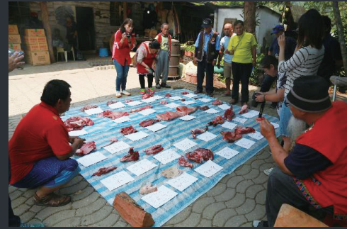
圖6 山豬支解後，由部落長老解說其名稱 與文化意義。 （圖片來源：浦忠勇攝，2019/4/26）