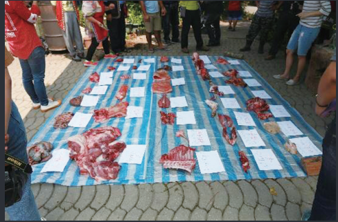
圖2 工作人員依長老指示將山豬各部位支解後標記鄒語及中文名稱 （圖片來源：浦忠勇攝，2019/4/26）