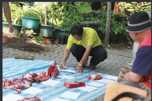
圖4 工作人員依長老指示將山豬各部位標記鄒語及中文名稱 （圖片來源：浦忠勇攝，2019/4/26）