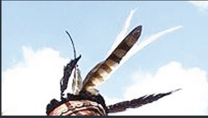
圖8 鄒族將禽尾羽佩飾在皮帽上象徵狩獵榮耀