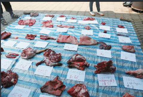
圖3 山豬各部位均標記鄒語及中文名稱