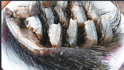
圖7 鄒族將山豬皮支解後並未將豬毛刮除，亦 作為獵物分配之用。

除上述的解剖知識，鄒人對山豬的大小、性別、年紀、棲息地以及生長狀況都有不同的認知與命名。茲摘錄研究者2020年採訪鄒族長老關於山豬相關的知識與習俗，包括山豬的命名、大小及生物特徵的描述，知識與命名，屬鄒族傳統動物觀的縮影。